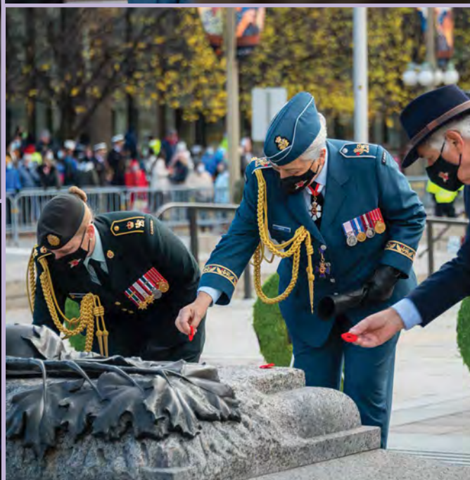
Top left - Photo credit/Mention de source: www.gg.ca Bottom left - Photo credit/Mention de source: Adam Scotti (PMO), Right - Photo credit/Mention de source: Sgt Mathieu St-Amour, Rideau Hall