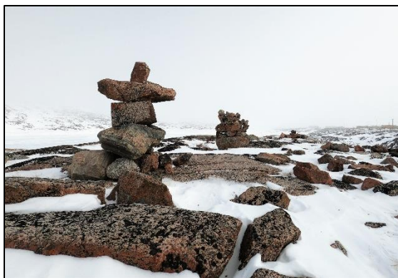
Inukshuk près de Kugaaruk, au Nunavut

Savoir polaire Canada a terminé avec succès l'évaluation de ses programmes de paiements de transfert, en s'assurant de leur pertinence, de leur efficacité et de leur efficience pour le respect du cadre ministériel des résultats de l'organisme. Cette évaluation démontre que les subventions et les contributions jouent un rôle crucial dans le développement de l'expérience et de l'expertise des étudiants, des chercheurs émergents et des membres des collectivités nordiques. Les projets financés par Savoir polaire Canada ont des répercussions importantes sur les écosystèmes et