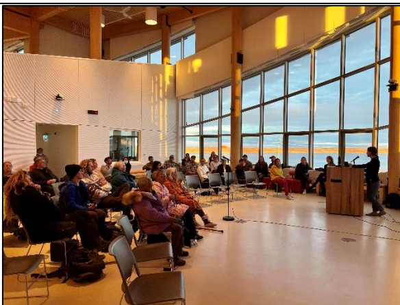
Conférence à la Station canadienne de recherche dans l'Extrême-Arctique

L'exploitation et le maintien du campus de la Station canadienne de recherche dans l'Extrême-Arctique en tant que centre de classe mondiale pour les sciences polaires permettront à Savoir polaire Canada de renforcer et d'élargir les collaborations en recherche au pays et à l'étranger et, en retour, d'acquérir des connaissances et une expertise pour relever les défis régionaux et circumpolaires.