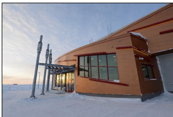
Bâtiment de recherche principal de la Station canadienne de recherche dans l'Extrême-Arctique

Savoir polaire Canada est l'organisme des sciences polaires du Canada. Il mène ses activités à partir du campus de calibre mondial de la Station canadienne de recherche dans l'Extrême-Arctique à Cambridge Bay, au Nunavut. Savoir polaire Canada effectue des recherches polaires multidisciplinaires et les publie. Grâce à son programme de subventions et de contributions, l'organisme aide financièrement le milieu universitaire, des collectivités nordiques et de l'Arctique et des organisations qui mènent des recherches et des projets connexes. Savoir polaire Canada vise à inclure dans la mesure du possible le savoir autochtone et local, ainsi qu'à accroître la coordination et la collaboration nationale et internationale en matière de recherche en tirant parti des ressources avec nos partenaires. Au moyen d'ateliers, de conférences, des médias sociaux et d'autres outils, Savoir polaire Canada favorise et promeut l'échange de connaissances avec les communautés scientifiques et politiques polaires, ainsi qu'auprès du grand public. Par l'intermédiaire de l'ensemble de ses activités principales, Savoir polaire Canada vise à aider financièrement et à former la prochaine génération de professionnels de la recherche polaire, avec un accent particulier mis sur la jeunesse du Nord et sur la jeunesse autochtone.