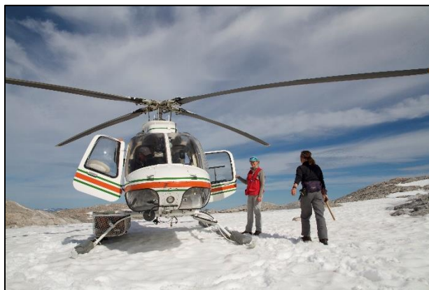
Un hélicoptère utilisé pour la recherche géologique, près d'Iqaluit, au Nunavut

Les initiatives de Savoir polaire Canada, alignées sur sa mission et conformes aux priorités du gouvernement du Canada, se sont concentrées sur la recherche durable dans l'Arctique, les partenariats avec les Autochtones et la mise en commun des connaissances. Grâce à l'amélioration de la mise en œuvre des programmes, à la modernisation des infrastructures et à la recherche scientifique innovante, Savoir polaire Canada a renforcé les capacités de recherche, soutenu les collectivités nordiques et favorisé l'intendance environnementale. Son engagement en faveur de la mobilisation des connaissances, de l'engagement des jeunes et des collaborations internationales a largement contribué à renforcer le leadership du Canada dans le domaine des sciences et de la technologie polaires.