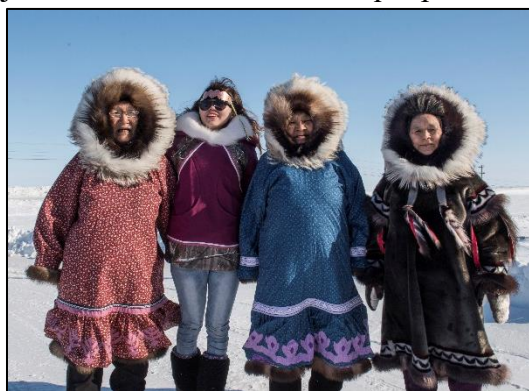
Résidentes de Cambridge Bay