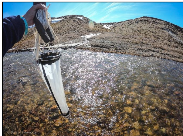
Déploiement d'un filet à zooplancton, Nunavut

Savoir polaire Canada a donné la priorité à la recherche arctique durable afin d'améliorer les connaissances sur les écosystèmes, le bien-être des collectivités et les solutions énergétiques dans le Nord et l'Arctique. Grâce à des protocoles d'entente avec l'Inuit Tapiriit Kanatami et le Conseil tribal des Gwich'in, l'organisme a fait progresser les objectifs de travail concernant la gouvernance de la recherche, les initiatives en matière d'énergie propre et la mise en commun des connaissances. Ces partenariats ont favorisé la représentation, la mobilisation et les connaissances locales des Autochtones. Savoir polaire Canada a participé