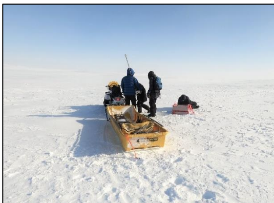
Équipe de chercheurs en motoneige près de Cambridge Bay, au Nunavut

Savoir polaire Canada a soutenu les efforts du Canada pour mettre en œuvre le Programme de développement durable à l'horizon 2030 des Nations Unies en contribuant à plusieurs de ses objectifs de développement durable. Conformément à la vision énoncée par la Stratégie nationale du Canada pour le Programme 2030, Savoir polaire Canada reconnaît que l'intégration de ces objectifs dans son propre travail le rapproche de l'amélioration de la durabilité, de la paix, de l'inclusivité et de la prospérité dans l'ensemble du Canada et du Nord et de l'Arctique. Savoir polaire Canada, compte tenu de l'importance de son mandat et des initiatives qu'il entreprend, a