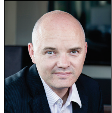
Dylan Jones Président intérimaire, Développement économique Canada pour les Prairies

En cette période de changements importants, PrairiesCan se laisse guider par une vérité immuable, soit qu'il est primordial que la région des Prairies soit forte pour que la nation le soit autant et puisse aspirer à une relance économique après la pandémie. Notre plan stratégique pour 2022-2023 est présenté dans les pages suivantes.