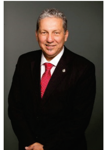
L'honorable Daniel Vandal Ministre des Affaires du Nord, ministre responsable de Développement économique Canada pour les Prairies et ministre responsable de l'Agence canadienne de développement économique du Nord

Notre plan de croissance inclut tout le monde. Les groupes sous-représentés qui font face à des obstacles supplémentaires à la réussite des entreprises continueront de trouver le soutien et l'expertise de PrairiesCan.